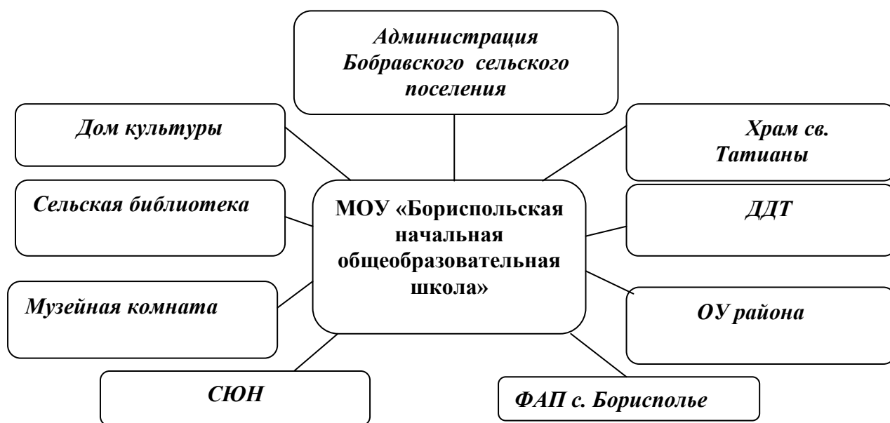
Схема взаимодействия с социумом

Среди родителей обучающихся и воспитанников детского сада преобладают служащие, работники бюджетной и торговой сферы. По материальному положению семьи детей распределяются следующим образом: семьи с низким уровнем доходов (уровень доходов в семье на человека ниже прожиточного минимума) – 15 %; со средним – 85 %; с высоким – 0 %.